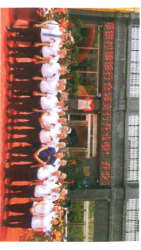
仓城支行乔迁开业仪式圆满顺利完成