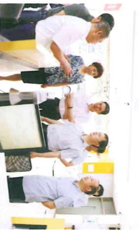
调研组实地参观该行营业网点

6月25日，济源市委副书记、市长石迎军到济源齐鲁村镇银行调研。市委常委、常务副市长王惠民参加调研，市政府秘书长翟伟栋、副秘书长常泽林、市财政局局长王利民、人民银行济源市